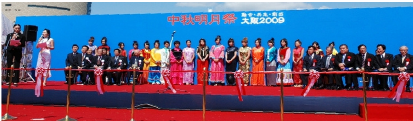
2009年中秋明月节開幕式

大阪中秋明月节活动始于2009年，以中华人民共和国建国60周年为契机，在日华侨华人表达对祖国，对亲人的眷恋之情，也为增进华侨华人之间、中国人与日本人之间的相互交流和相互理解而搭建的平台。在中日两国各界以及在日华人华侨的共同努力下，已成功地举办了3年。成为了日本关西地区的规模最大，备受关注的展示关西华侨华人风采、弘扬中国文化、中日相互交流的盛会，作为中日文化、经济、民间往来的交流平台，也为日本民众带来了更多体验中国文化活动的机会。