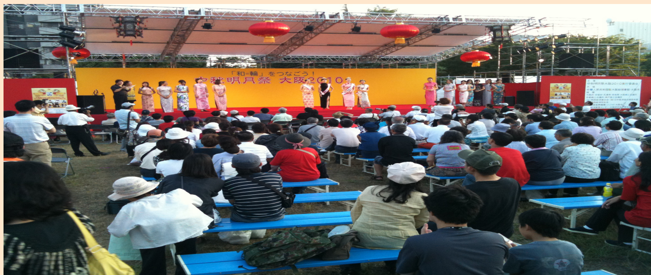
2010年中秋明月节会场