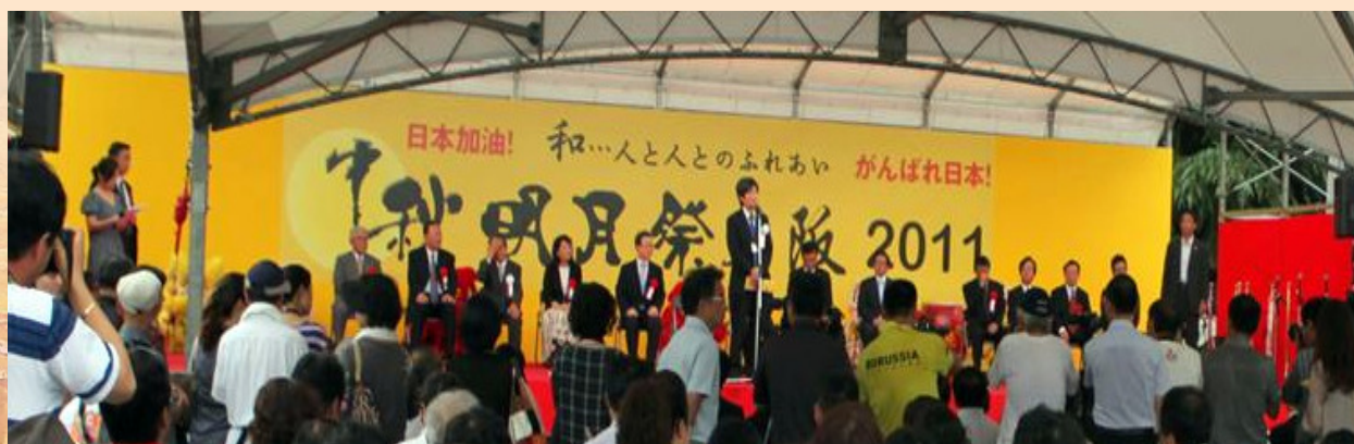
2011年中秋明月节开幕式