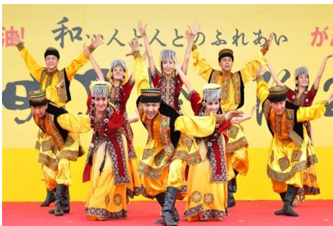
(新疆親情中華芸術団)