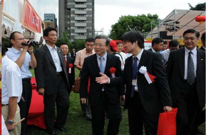
(会場を視察する程永華中国大使)