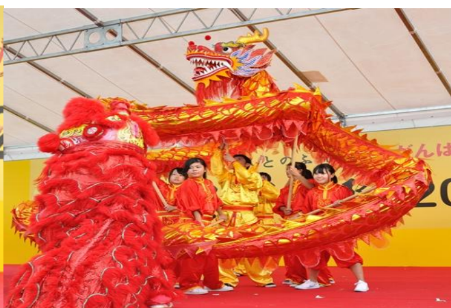
(大阪府立成美高校)