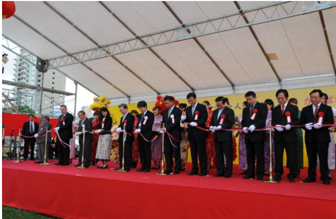
(開幕式テープカット時の様子)