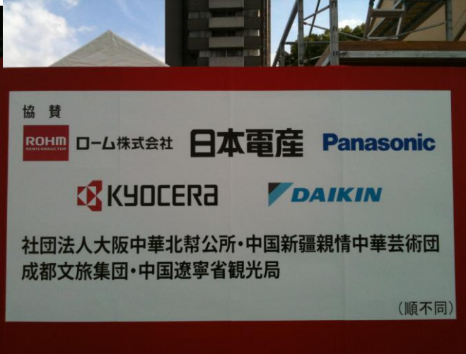
(協賛企業・団体看板)