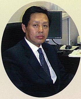
中国駐大阪総領事館 総領事 鄭祥林

值此“中秋明月祭大阪2009”即将召开之际，我谨代表中国驻大阪总领事馆表示由衷的祝贺，同时对给予本次活动热情关心与大力支持的大阪府、大阪市等各界人士表示诚挚谢意，向付出辛勤努力的执行委员会成员表示敬意。